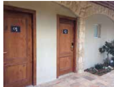
הבלוט, בלוגו המלון, שימש כמוטיב מרכזי בעיצוב שילוט מספרי החדרים