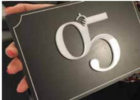
במסגרת התהליך, עוצב פונט נומרי המורכב מלוגו המלון: